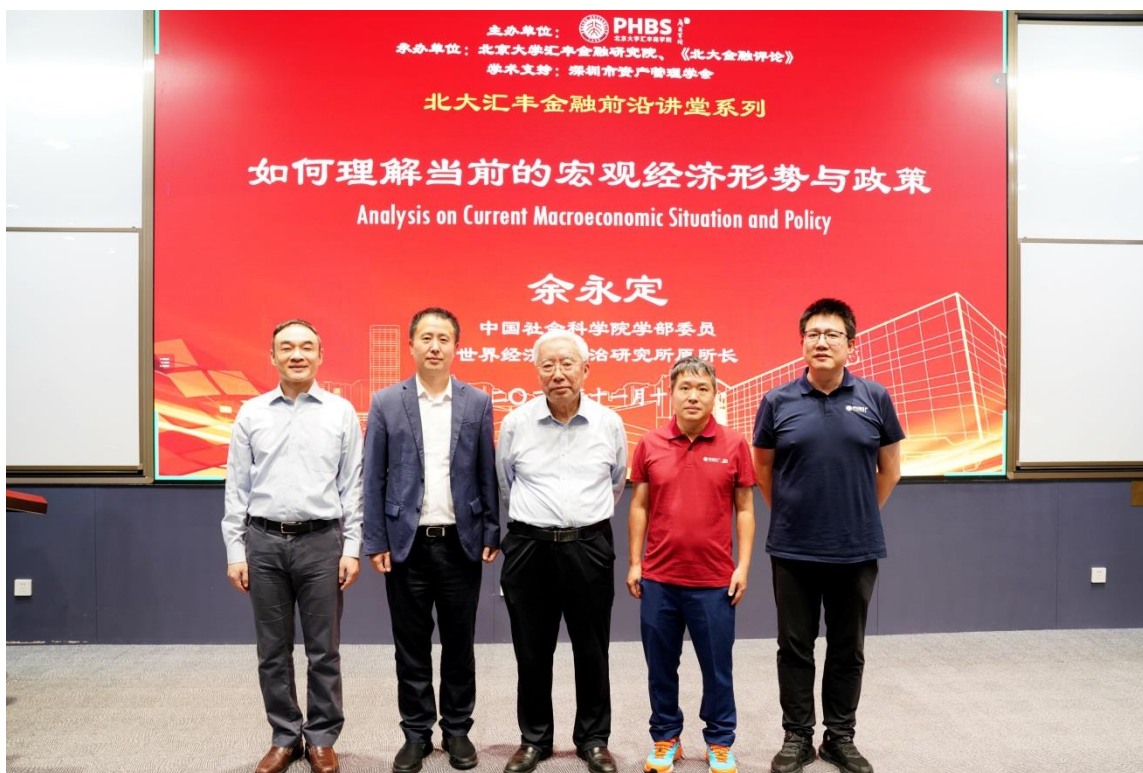
▲金融前沿讲堂（左起）：北京大学汇丰金融研究院副院长李菽，深圳市地方金融管理局局长时卫干，中国社会科学院学部委员、世界经济与政治研究所原所长余永定，北京大学博雅特聘教授、北京大学汇丰商学院院长王鹏飞，北京大学汇丰商学院金融学教授、院长助理李凯