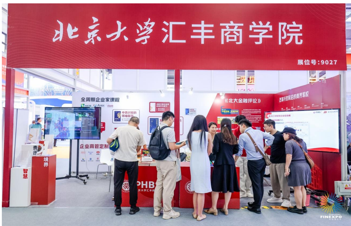
▲第十八届深圳国际金融博览会学院展位

2024 年 11 月 7-9 日，第十八届深圳国际金融博览会于深圳福田会展中心举办，北京大学汇丰金融研究院和 EDP 项目共同参展，负责学院建院 20 周年品牌宣传、《北大金融评论》刊物推广、学院各学位项目宣传、金融研究院讲座信息推广，获金博会主办方感谢信表彰。